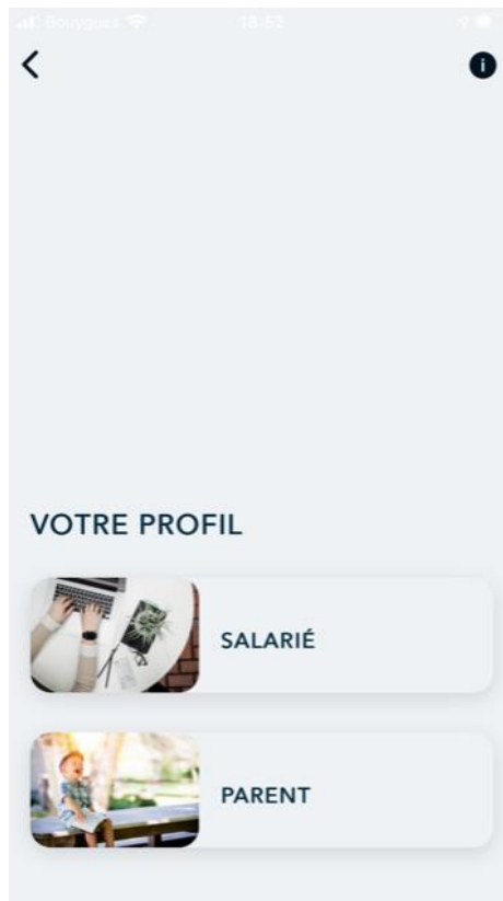
Choisir « PARENT »