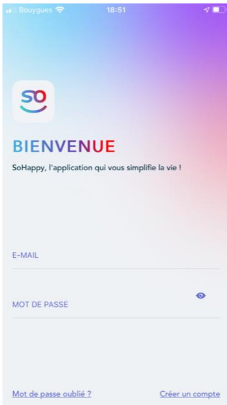
Choisir « créer un compte »